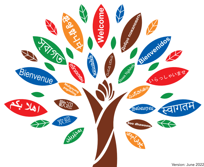
Version: June 2022